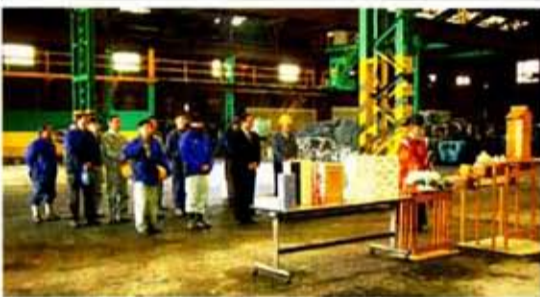
3月21日大同機器など関係者を招いてエコサーボプレス完工の神事を執り行なった。