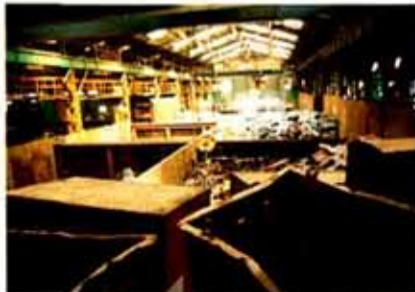
1250tギロチン棟を奥から見た(手前は大型抜缶と奥は山盛りとなった仕分け棚)