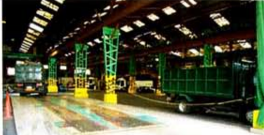
受入れは事務所前の計量器(70t)、屋内収容のトレーラー計量器(80t)は出荷専用に入出荷の流れを整理