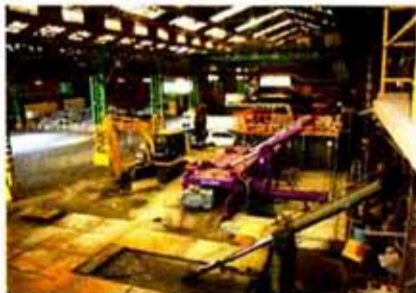
プレス棟に収まった大同機器の「エコサーボプレス」手前のプレスは中古販売予定