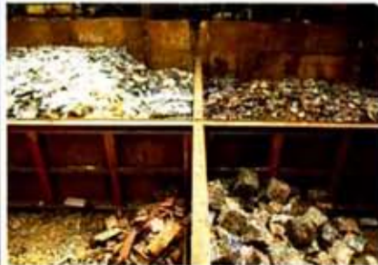
品種、サイズ、メーカー好みごとに仕分け棚で区分管理している(即出荷が可能)