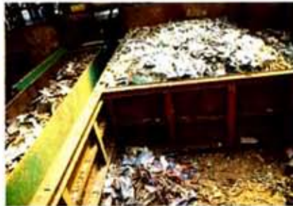
写真左は仕分け棚の通路で積み込むトレーラー(積み込み完了で手前の棚はカラ)