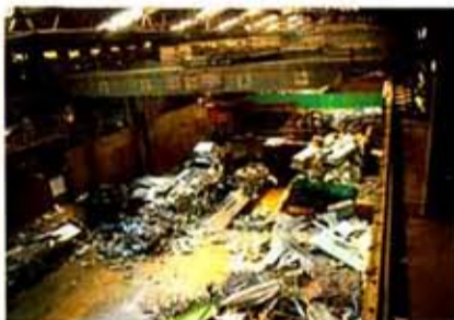
1250tギロチン棟を手前から見下ろした(天井クレーンでギロチン材を装入中)