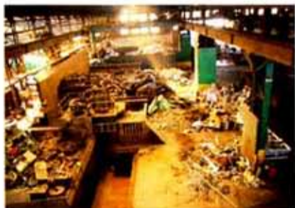
1600tギロチン棟を手前から見下ろした(奥にトレーラーの積み込みが見える)