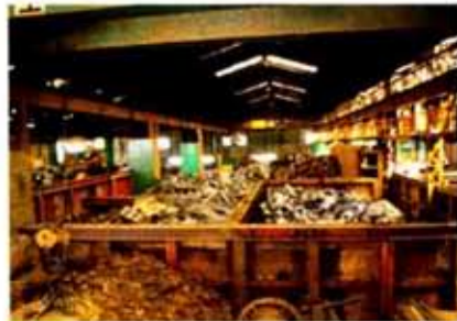
1600tギロチン棟を奥から見た(手前から仕分け棚がサイズ、メーカー分類で整然と並ぶ)