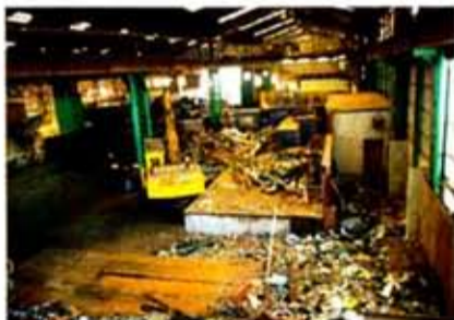
1000tギロチン棟を手前から見下ろした(投入用の0.9㎡ユンボが見える)