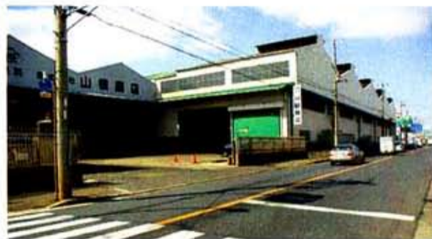
堺市堺区海山町2-55の山根商店の本社工場(13,200㎡)。グーグルマップの衛星写真から広大な工場全景が見える